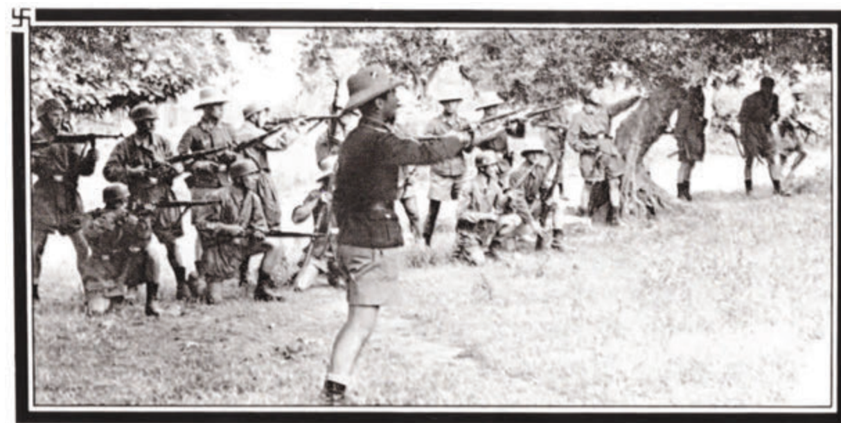
Σκηνή από την εκτέλεση στο Κοντομαρί, ένα από πρώτα εγκλήματα των κατακτητών